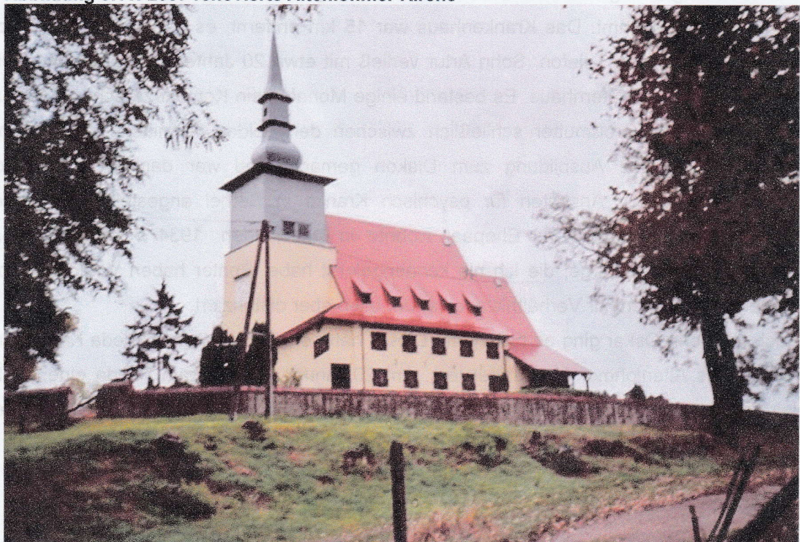
Abbildung 3.11: 2007 renovierte Altenlohmer Kirche